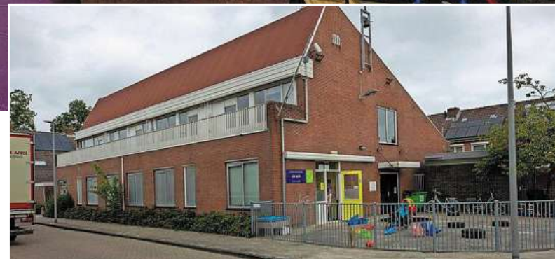
Buitenkant van het gebouw aan Val van Urk 7.

hele pand te renoveren waarbij kantoor-/vergaderruimtes en een op maat gemaakte raadszaal gecreëerd kunnen worden. De uitstraling en de mate van luxe (zowel aan de binnen- als buitenzijde) hebben we zelf in de hand.” Tegelijkertijd kan het pand verduurzaamd worden. „Denk hierbij aan het isoleren, het